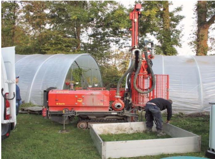
Die Bauarbeiten zum Solarbrunnen erfordern schweres Gerät.

Die Zukunft gehört den erneuerbaren Energien, darum wollen wir mit Sonnenkraft Wasser pumpen. Das hört sich nicht nur innovativ an, es ist es auch, aber in der Umsetzung nicht so einfach wie vermutet, besonders wenn fast alles ehrenamtlich passiert. Und es dauert. Für solarbetriebene Brunnen braucht es besondere Pumpen, diese gibt es bei einer Firma in Süddeutschland. Die