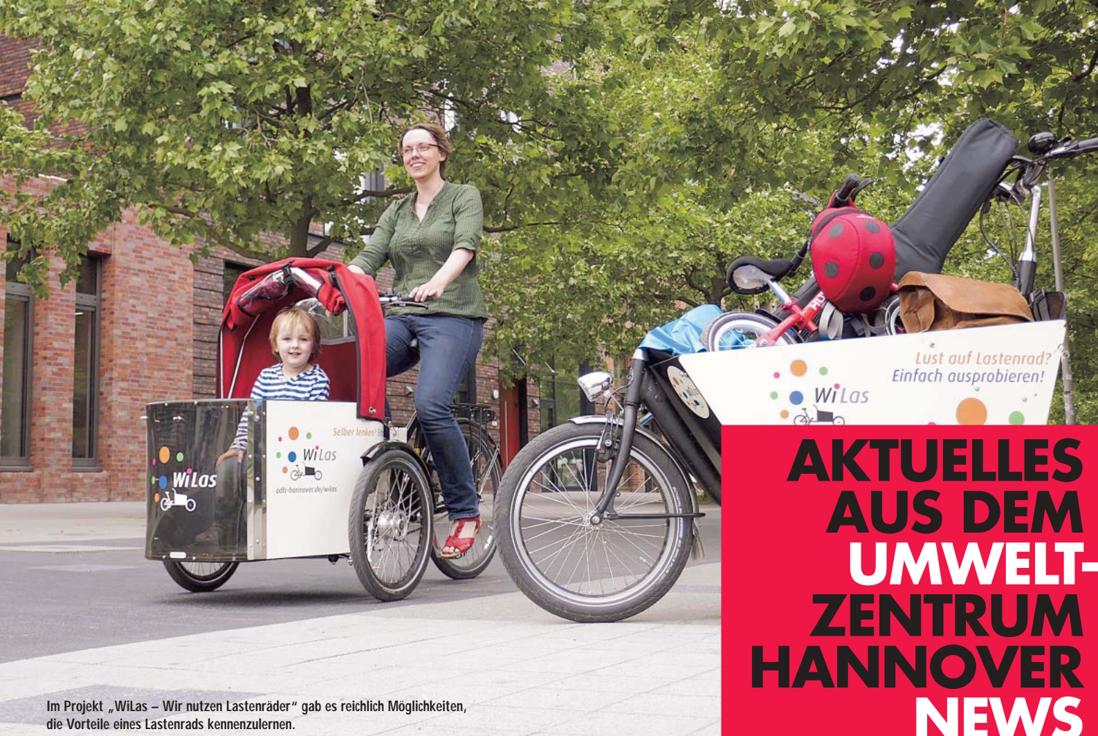
Im Projekt „WiLas – Wir nutzen Lastenräder“ gab es reichlich Möglichkeiten, die Vorteile eines Lastenrads kennenzulernen.