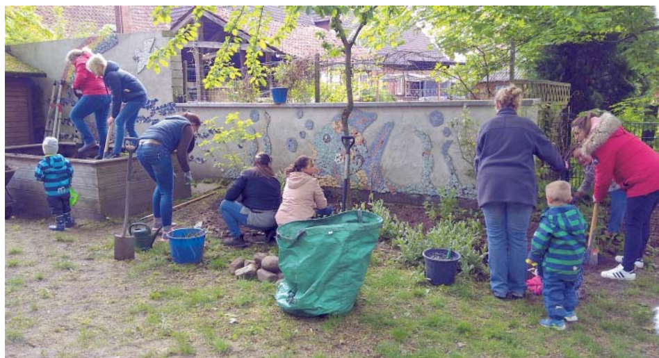
Kinder und Erwachsene sind bei NaturKids gleichermaßen motiviert.

Mit dem Modellprojekt „NaturKids – Natur und Insekten für Kindergartenkinder“ integrierte das Umweltzentrum Hannover in den vergangenen Monaten frühkindliche Umweltbildung in den Alltag einer Kita. Bei zwölf Aktivitäten wurden gemeinsam mit den Kindern, den Erzieher*innen und fallweise auch mit Unterstützung der Eltern Beete bepflanzt, ein Weidentipi gebaut, Nist-